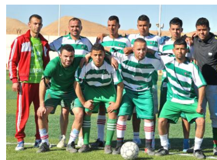
La sélection de l'Association des Sourds-Muets de Ouargla

Les deux rencontres ont été remportées par la sélection ENAFOR.