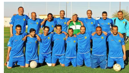
La sélection de l'ENGCB