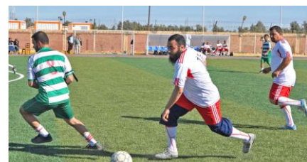
De gauche à droite: Les joueurs à la tribune d'honneur à l'issue de la 1 ère rencontre, séquence de la deuxième rencontre, séquence du premier match