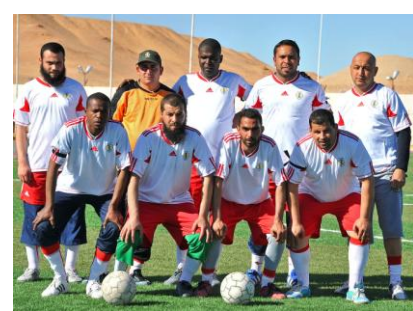
la sélection ENAFOR

Dans le cadre de la commémoration du 24 février, marquant le double anniversaire de la nationalisation des hydrocarbures et la création de l'Union Générale des Travailleurs Algériens, l'Entreprise Nationale de Forage a organisé un tournoi de football.