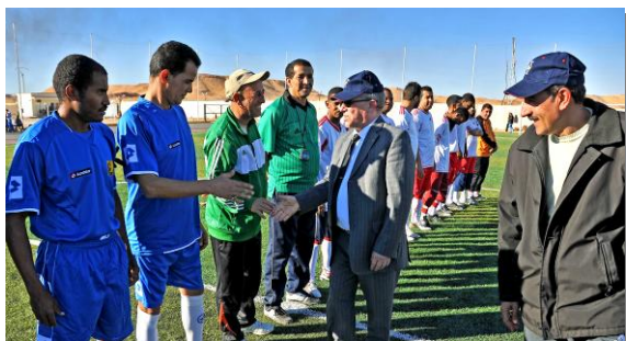
M. le PDG d'ENAFOR salue les joueurs et donne le coup d'envoi du tournoi